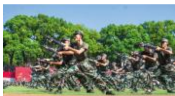
突击动作 迅猛有力