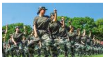
军体拳表演 中帼不让须眉