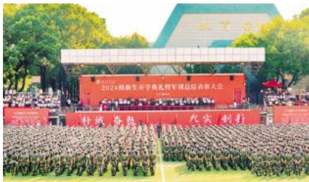
沙场秋点兵 秣马见真功