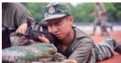
屏息瞄准 直击目标