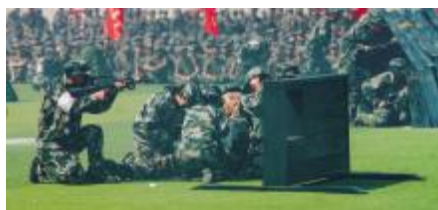
“火线”救援 刻不容缓