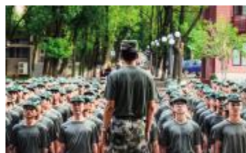
日出日落 渐显军人风采