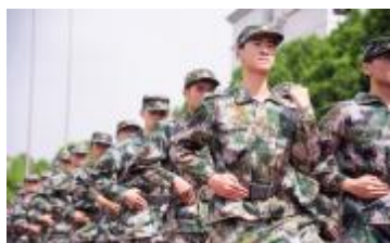
演绎战术动作 双翼坚定