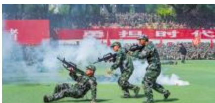
穿越“硝烟” 置身“战地”