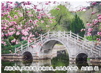
廊桥映水，风拂花影，曼舞轻盈，只见春色如诗