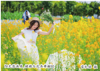
阳光洒满肩，裙裾与花朵共翩跹

这便是湘农的春天——花是热烈的，泥土是温热的，人更是充满活力的。田里的新苗正奋力向上，地头的农事也紧锣密鼓地向前推进。一年之计在于春，湘农的春天，不仅是一幅生机勃勃的画卷，更是一种蓬勃向上的力量。这劲儿，是拔节生长的劲儿，是奋力前行的劲儿。（文/徐晶）