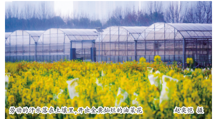
劳动的汗水落在土壤里，开出金黄灿烂的油菜花