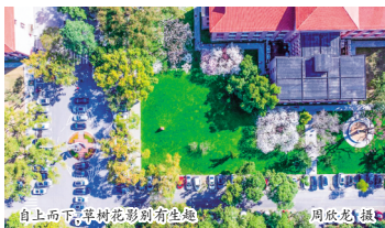
自上而下，草树花影到有生机