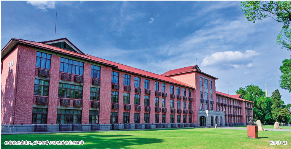
红墙映衬着蓝天，前坪绿草正诉说与和煦的故事