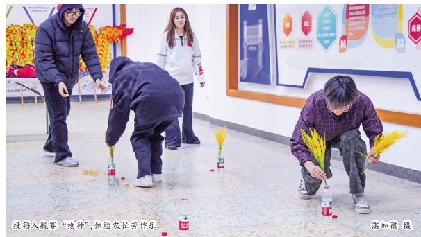
投入瓶赛“抢种”，体验农忙劳作乐