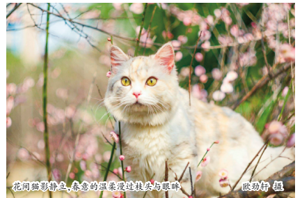
花间猫影静立，春意的温柔漫过鼻尖与眼眸