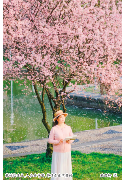
粉樱绽放，人在园中游，静赏春光不负时