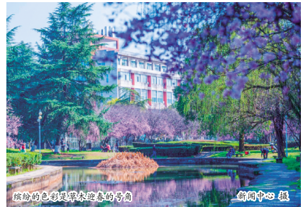
缤纷的色彩是草木迎春的号角