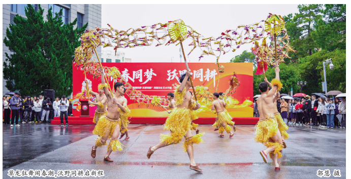
草龙狂舞闹春潮，沃野田间启新程