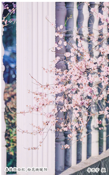
春意染白栏，粉花映暖阳